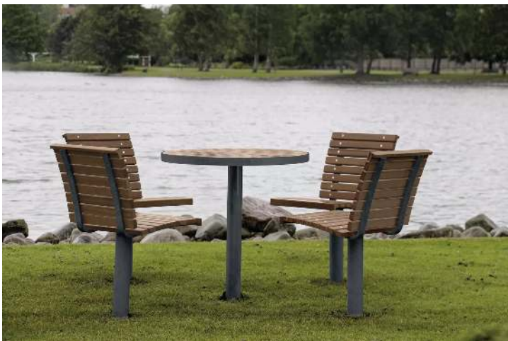
Sitze FJORDPARK ohne Armlehnen und Tisch FJORDPARK, Stahlteile in RAL 7024 graphitgrau