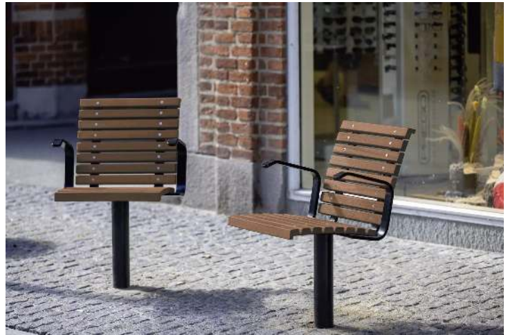
Sitze FJORDPARK mit Armlehnen, Stahlteile in RAL 9005 tiefschwarz