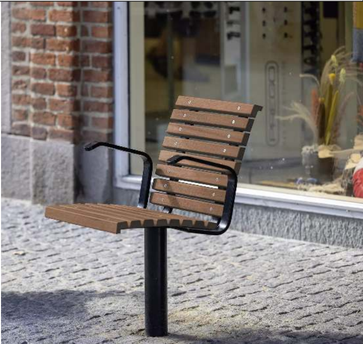
Sitz FJORDPARK mit Armlehnen, Stahlteile in RAL 9005 tiefschwarz