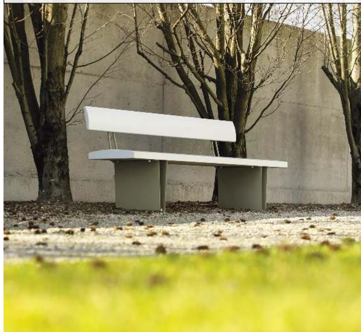
Sitzbank MALY mit Rückenlehne, HPC-Beton in weiß, Stahlteile in RAL 6013 schilfgrün