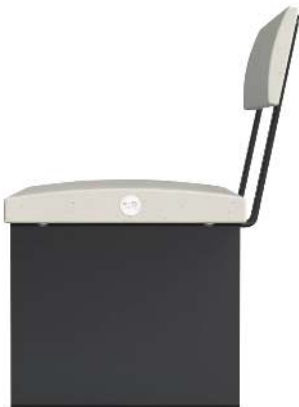
Detail: Seitenansicht, Sitzbank MALY mit Rückenlehne, HPC-Beton in weiß, Stahlteile in RAL 7016 anthrazitgrau