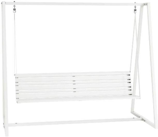
Schaukelbank MANTUA in RAL 9003 signalweiß