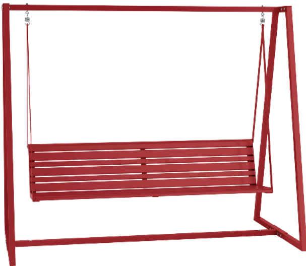
Schaukelbank MANTUA in RAL 3000 feuerrot