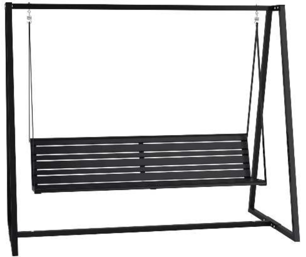
Schaukelbank MANTUA in RAL 9005 tiefschwarz