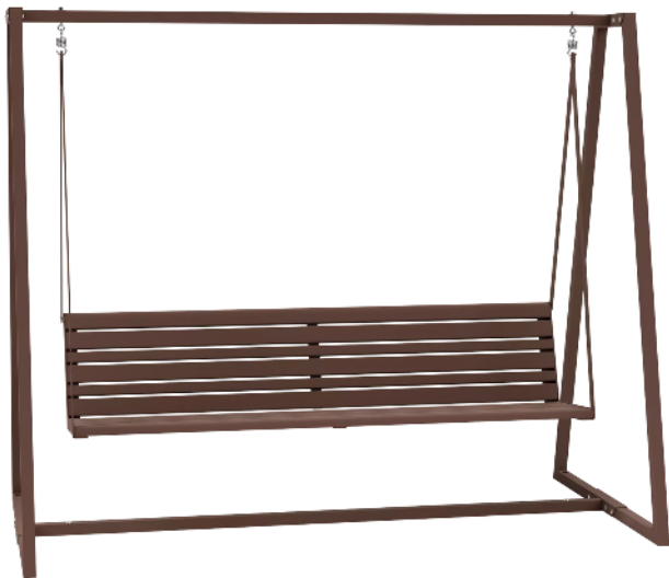
Schaukelbank MANTUA in corten