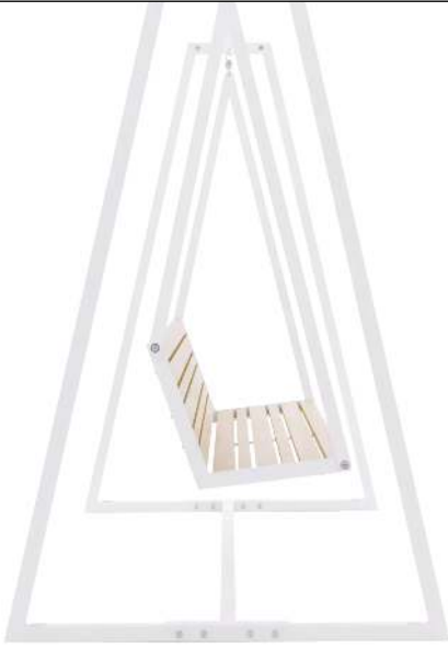
Schaukelbank MANTUA, Aluminium in natürlichem Eschenholzoptik-Effekt, Stahlteile in RAL 9003 signalweiß