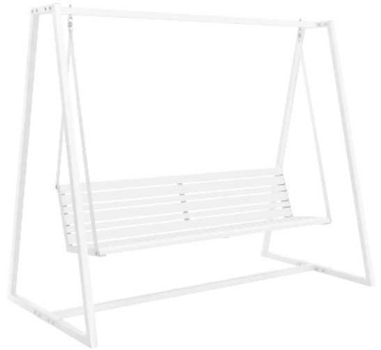
Schaukelbank MANTUA in RAL 9003 signalweiß