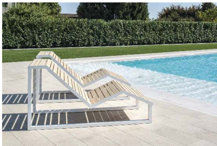
Liegebank MANTUA, Aluminium in natürlichem Eschenholzoptik-Effekt, Stahlteile in RAL 9003 signalweiß