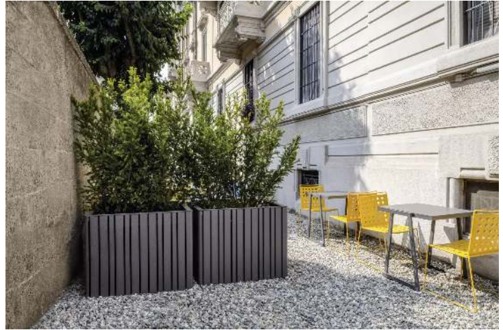
Pflanzbehälter MANTUA, 210 Liter, in eisenglimmergrau