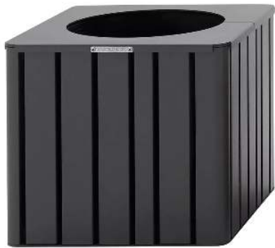
Pflanzbehälter MANTUA, 25 Liter, in eisenglimmergrau