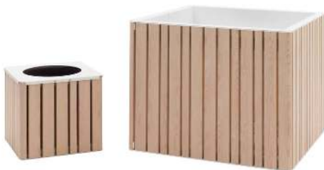
Pflanzbehälter MANTUA, 25 Liter und 210 Liter, Aluminium in natürlichem Eschenholzoptik-Effekt, Stahlteile in RAL 9003 signalweiß