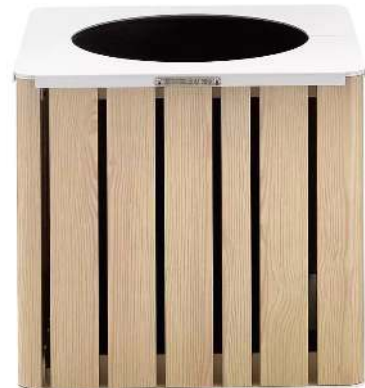
Pflanzbehälter MANTUA, 25 Liter, Aluminium in natürlichem Eschenholzoptik-Effekt, Stahlteile in RAL 9003 signalweiß