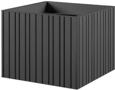
Pflanzbehälter MANTUA, 210 Liter, in eisenglimmergrau