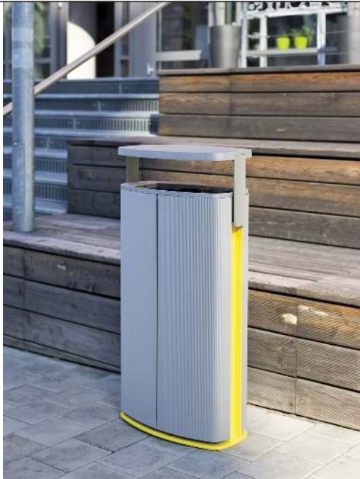
Abfallbehälter MINIUM mit Schutzdach, Standbehälter zum Aufdübeln, Stahlteile in Sonderfarbe (auf Anfrage)