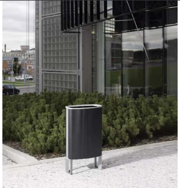
Abfallbehälter MINIUM mit seitlichen Pfosten zum Aufdübeln, Korpus in Sonderfarbe (auf Anfrage), Stahlteile in RAL 9007 graualuminium