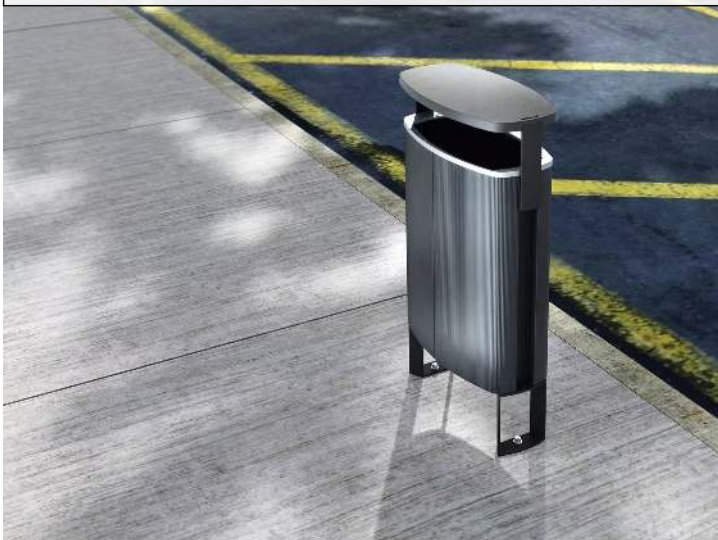
Abfallbehälter MINIUM mit Schutzdach, mit seitlichen Pfosten zum Aufdübeln, Korpus in Sonderfarbe (auf Anfrage), Stahlteile in RAL 9005 tiefschwarz