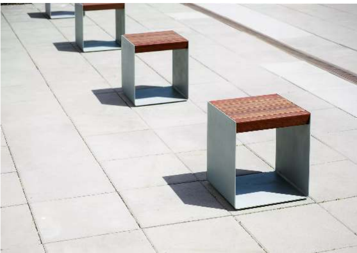
Sitz RADIUM mit Jatobaholzbelattung, Stahlteile in RAL 9007 graualuminium