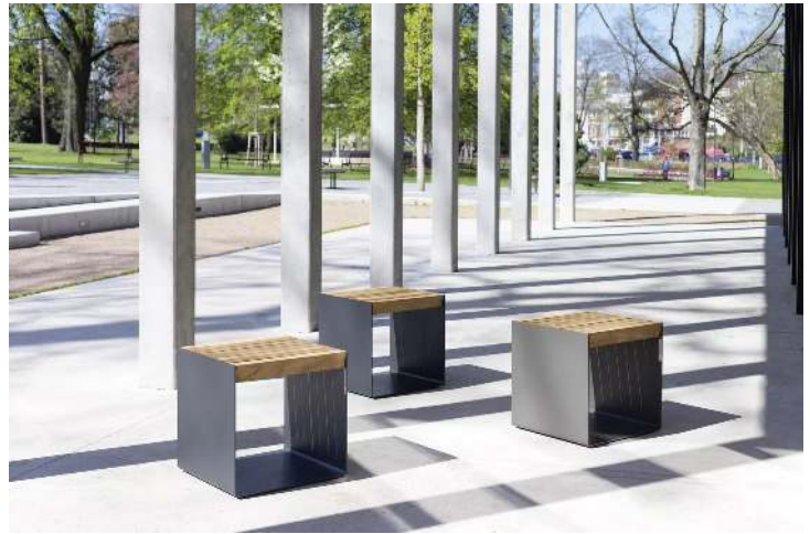
Sitz RADIUM mit Robinienholzbelattung, Stahlteile in RAL 7016 anthrazitgrau und DB 703 eisenglimmer