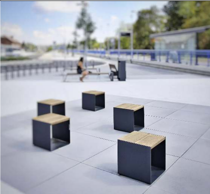
Sitz RADIUM mit Robinienholzbelattung, Stahlteile in RAL 7016 anthrazitgrau