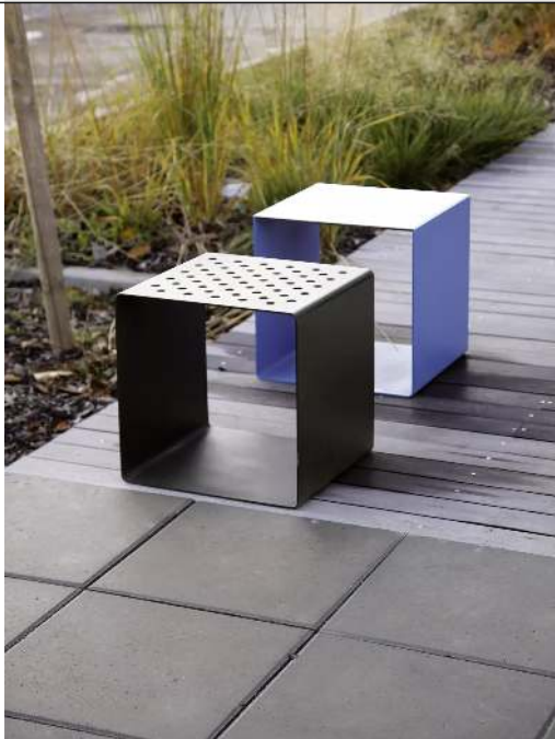
Sitzhocker RADIUM mit Kunststoffknoppen bzw. mit Auflagen aus HPL (im Webshop erhältlich)