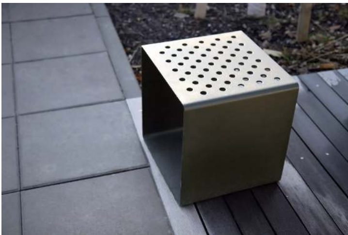
Sitz RADIUM mit Kunststoffnoppeln, in RAL 9005 tiefschwarz