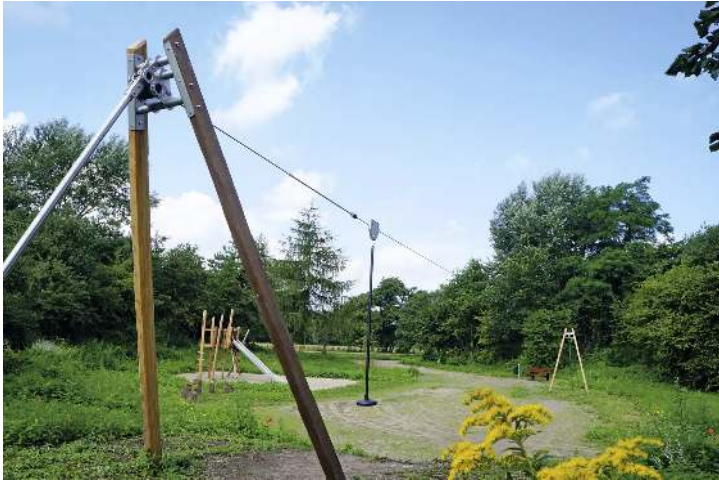
Seilbahn JORUN ohne Startplattform