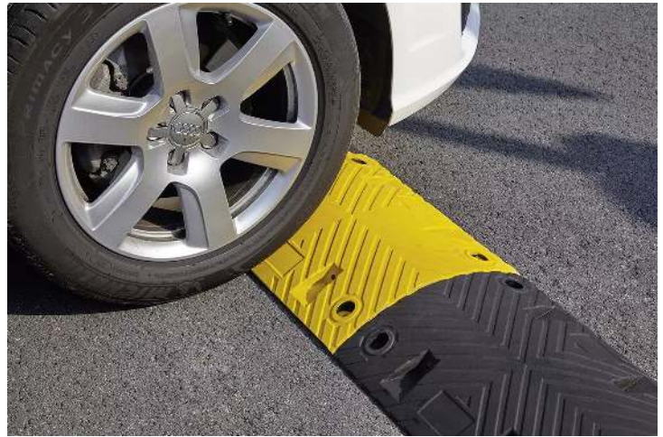
Fahrbahnschwellen KAMP aus Recyclinggummi