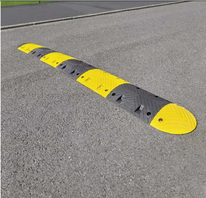
Fahrbahnschwellen-Set KAMP aus Recyclinggummi, Länge 3500 mm