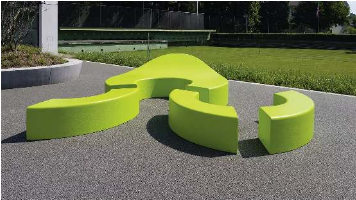
Sitzbank JOA small und Sitzbank JOA big in Sonderfarbe auf Anfrage