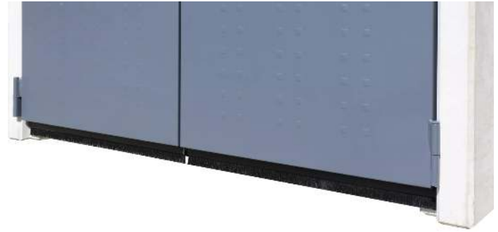
Detail: einstellbares Bodenabschlussblech gegen Nagetiere zum Erhalt der Hygiene