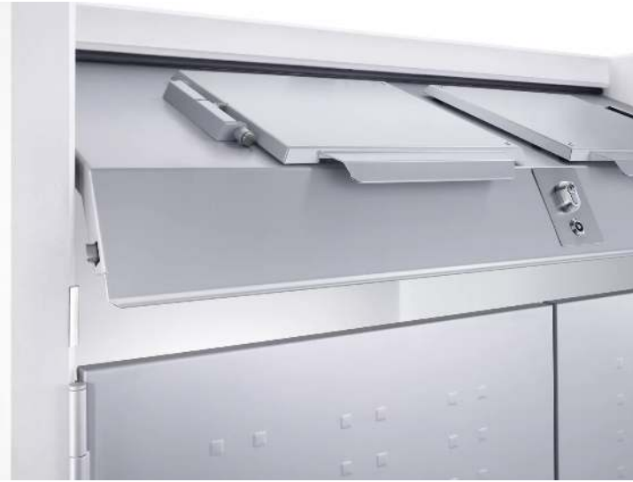
Detail: zentrale Schließung