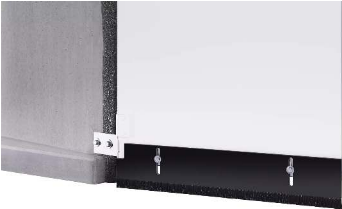
Detail: Bodenabschlussblech, einstellbar