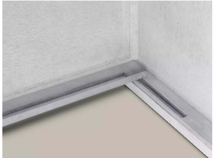
Detail: stufenlos einstellbares Schrammboard