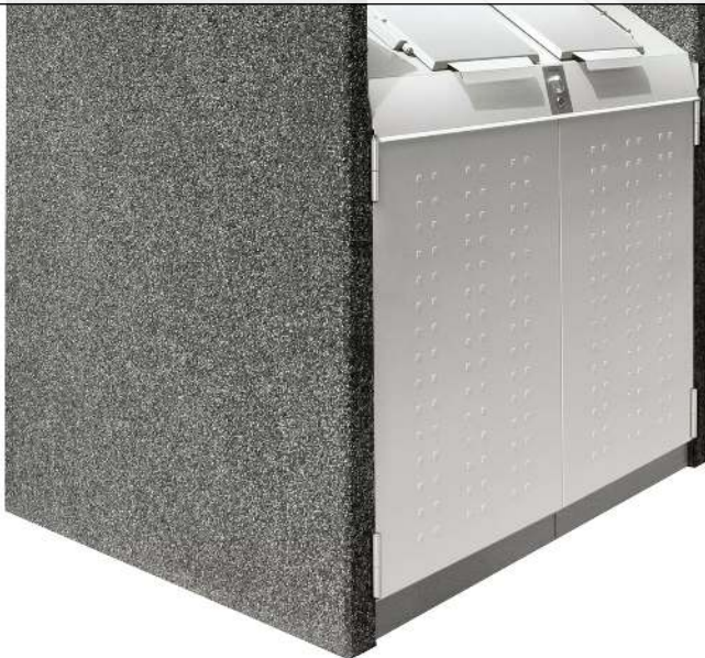
Containerbox DARWEN, Korpus Sichtbeton gewaschen in perlgrau, Stahlteile in weißaluminium ähnlich RAL 9006, mit zentraler Schließung (Mehrpreis)