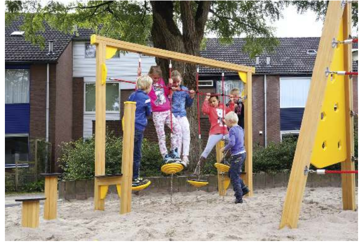
Balancierstrecke OLIVER, Element E