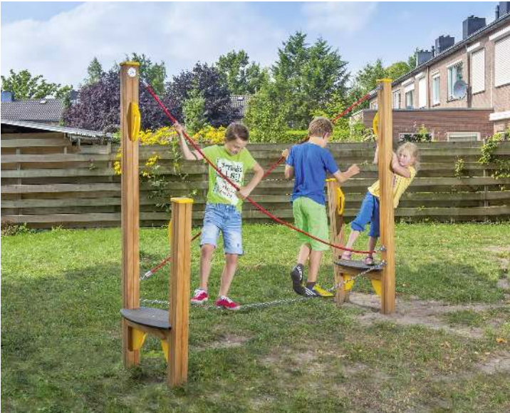
Balancierstrecke OLIVER, Element C