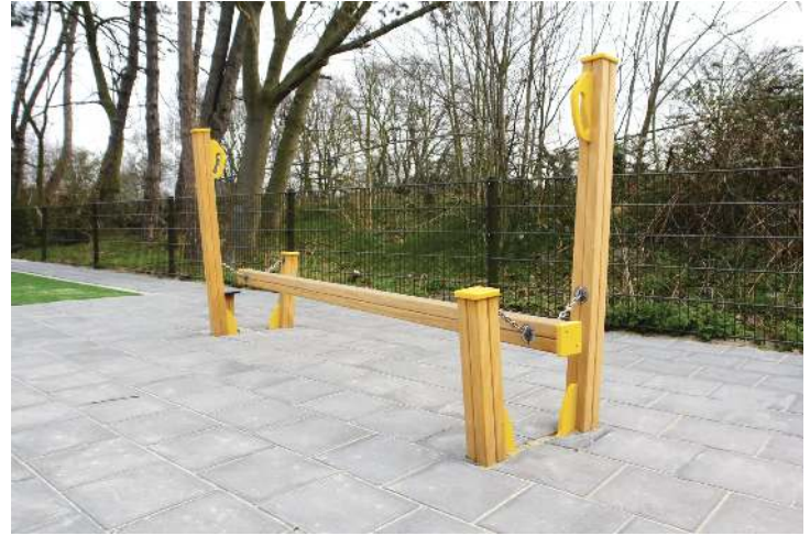
Balancierstrecke OLIVER, Element J