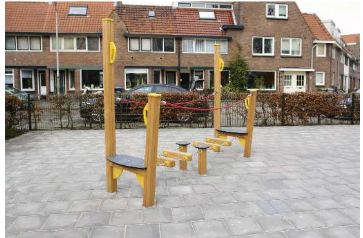
Balancierstrecke, Element A