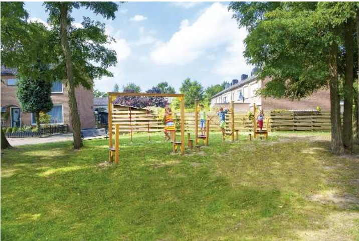
Balancierstrecken OLIVER, verschiedene Elemente