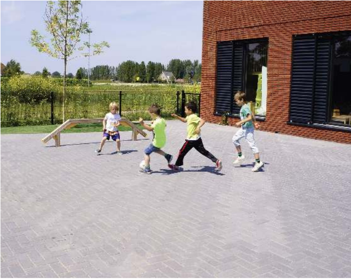
Balancierstrecke OLIVER, Element I