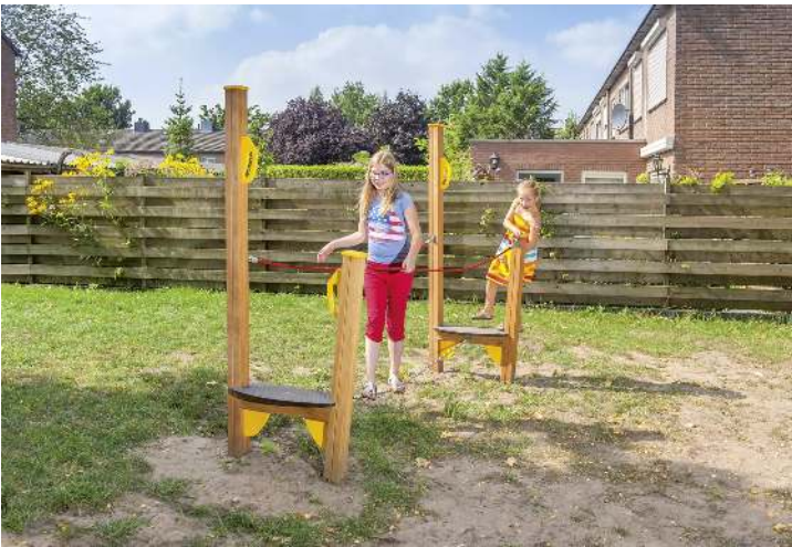
Balancierstrecke OLIVER, Element B