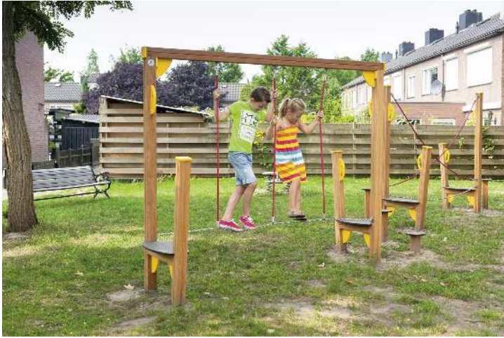
Balancierstrecke OLIVER, Element D