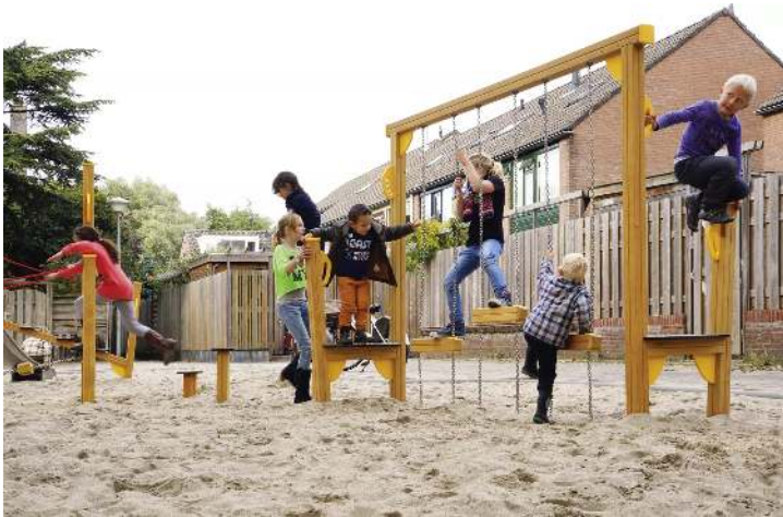
Balancierstrecke OLIVER, Element F