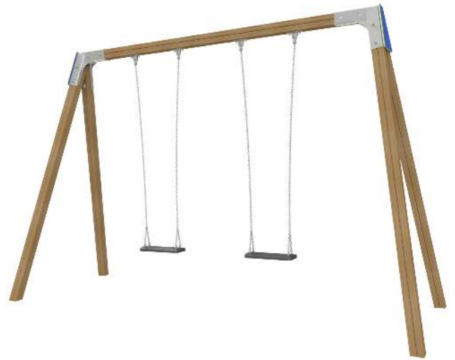
Kleinkindschaukel SWAY mit 2 mit Standard-Sicherheitsschaukelsitzsitzen, Schaukelbalken in Holz