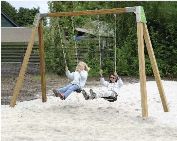
Doppelschaukel SWAY mit Standard-Sicherheitsschaukelsitzen, Schaukelbalken aus Holz