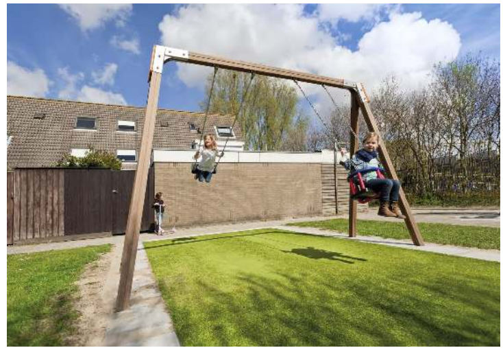
Doppelschaukel SWAY mit Standard-Sicherheitsschaukelsitz und Kleinkind-Sicherheitssitz, Schaukelbalken aus Holz