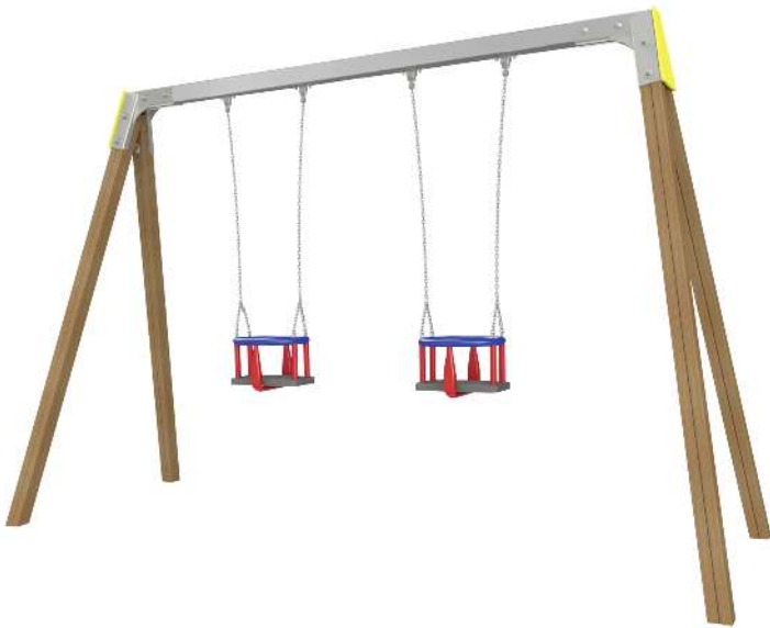
Kleinkindschaukel SWAY mit 2 Kleinkind-Sicherheitssitzen, Schaukelbalken in Edelstahl