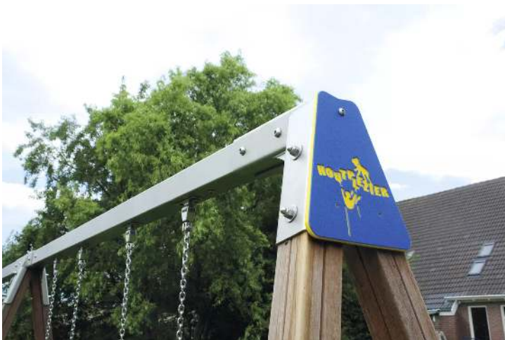
Detail: Schaukelbalken aus rostfreiem Edelstahl