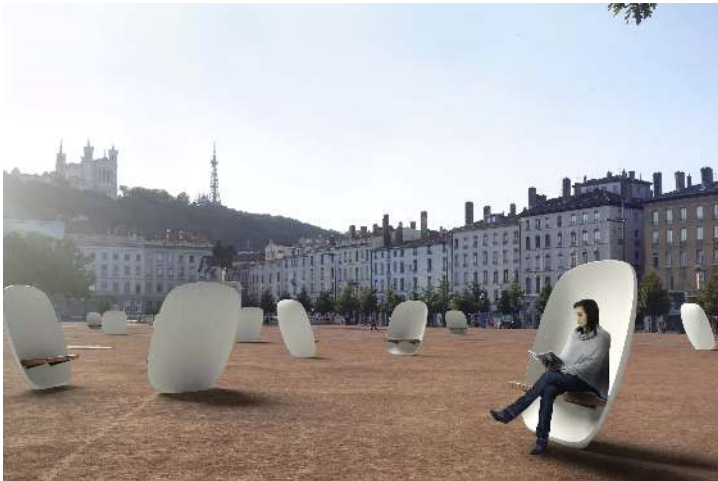
Sitzbank SATELLITE mit Jatobaholzbelattung