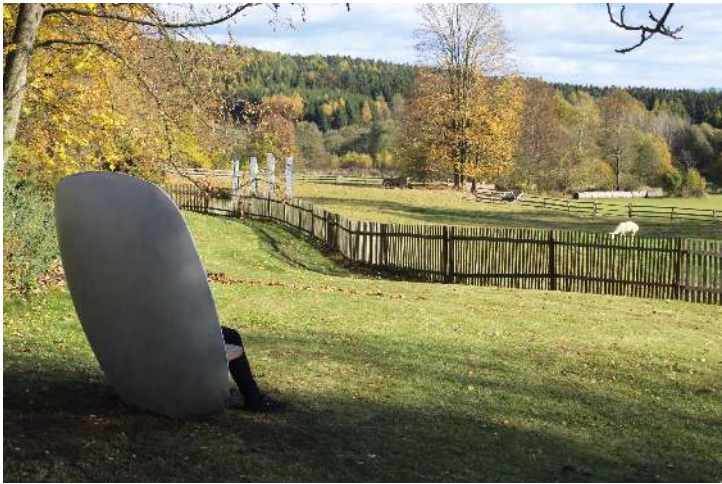
Sitzbank SATELLITE mit Jatobaholzbelattung