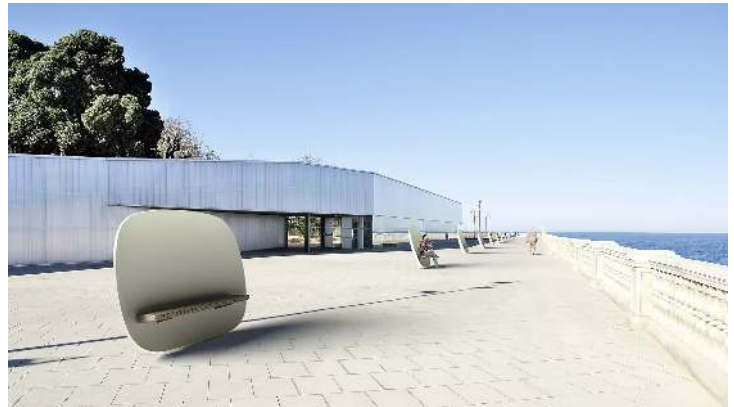
Sitzbank SATELLITE mit Robinienholzbelattung