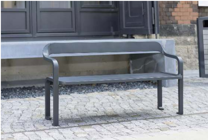
Sitzbank IMAWA in RAL 7016 anthrazitgrau