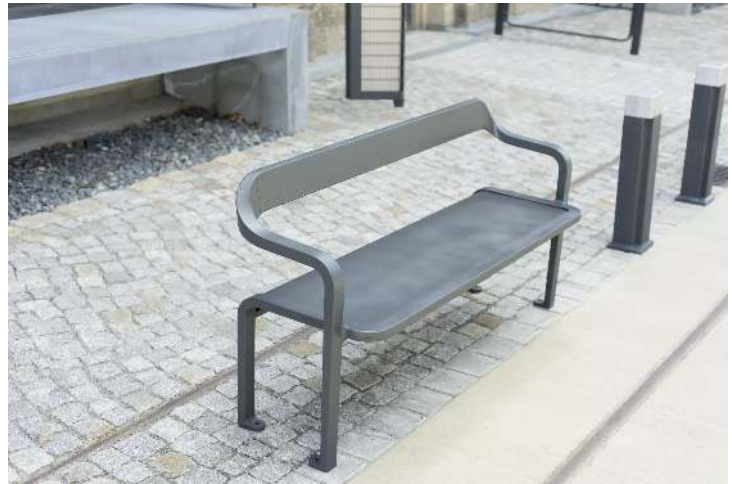
Kollektion IMAWA bestehend aus Sitzbank, Abfallbehälter und Poller