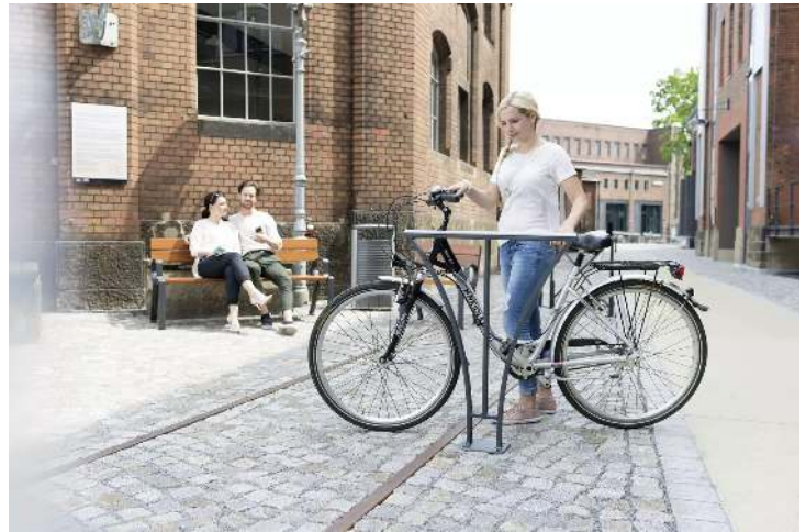
Kollektion BASIC bestehend aus Anlehnbügel, Sitzbank und Abfallbehälter