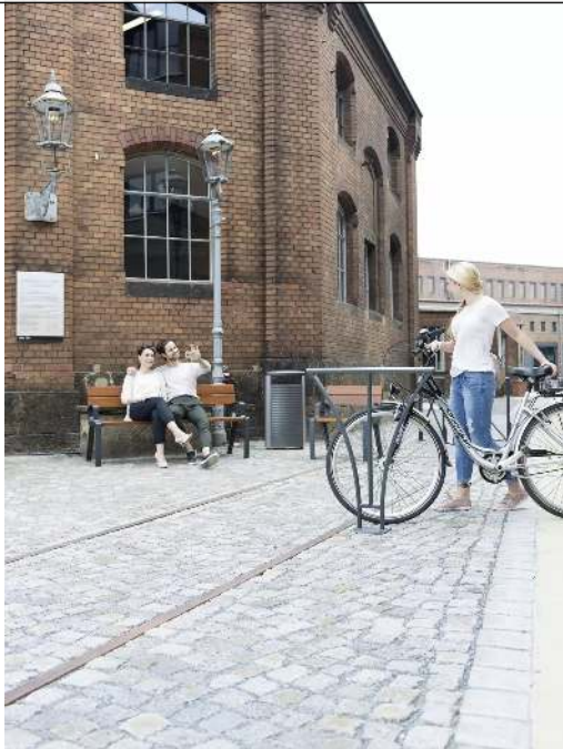
Kollektion BASIC bestehend aus Anlehnbügel, Sitzbank, Sitz und Abfallbehälter