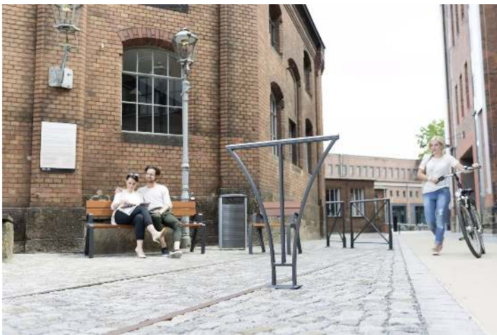
Kollektion BASIC bestehend aus Anlehnbügel, Sitzbank, Sitz, Abfallbehälter und Geländersystem