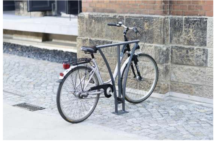
Anlehnbügel BASIC zum Aufdübeln, Stahlteile in RAL 7016 anthrazitgrau