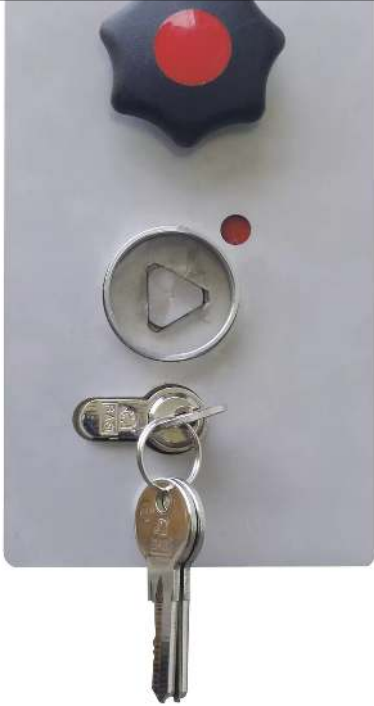
Schlosskasten mit PZ und DK