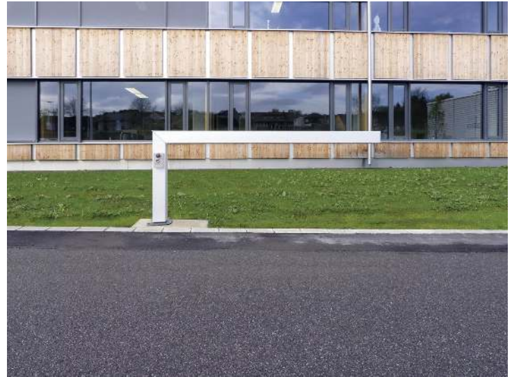
Wegesperre FALUN, Sperrbreite 1,5 m, zum Aufdübeln