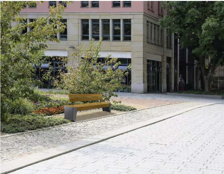
Sitzbank FOLA mit Rückenlehne, Stahlteile in DB 703 eisenglimmer