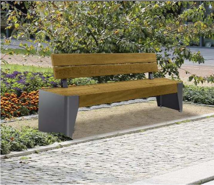
Sitzbank FOLA mit Rückenlehne, Stahlteile in DB 703 eisenglimmer