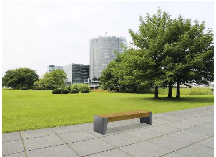
Sitzbank FOLA ohne Rückenlehne, Stahlteile in DB 703 eisenglimmer