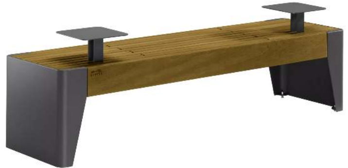
Sitzbank FOLA ohne Rückenlehne, mit Ablagetischen, Stahlteile in DB 703 eisenglimmer