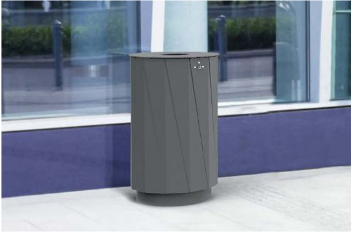
Abfallbehälter TENBY, 60 Liter, in RAL 7016 anthrazitgrau