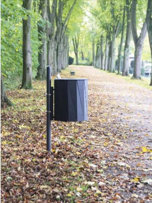
Abfallbehälter TENBY zur Pfosten-befestigung (Pfosten Zubehör), 50 Liter, in RAL 7016 anthrazitgrau