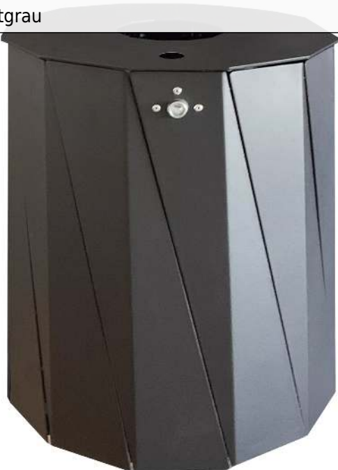
Abfallbehälter TENBY, 50 Liter, mit Ascher, in RAL 7016 anthrazitgrau