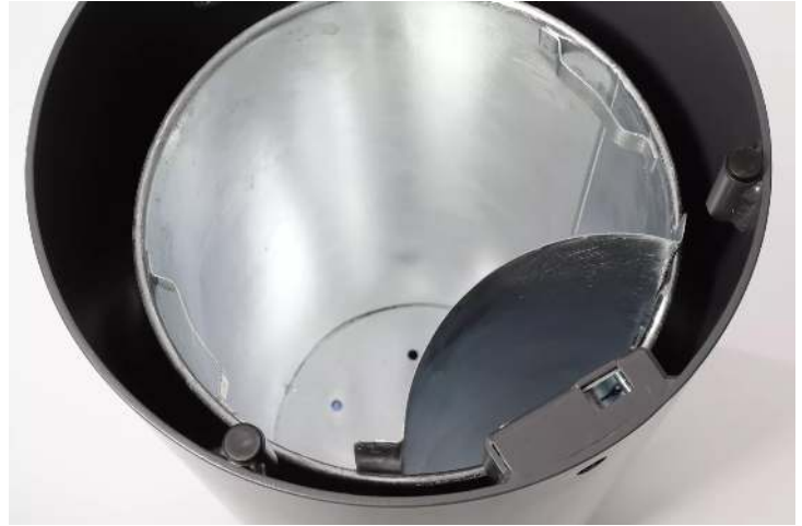
Detail: Einsatz Ascher