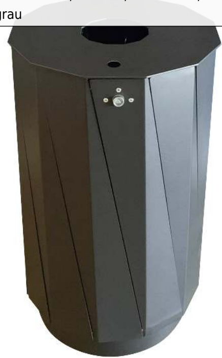
Abfallbehälter TENBY, 60 Liter, mit Ascher, in RAL 7016 anthrazitgrau