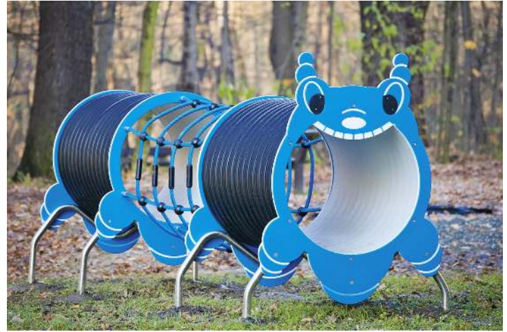
Spieltunnel ROSALIE in RAL 5015 himmelblau