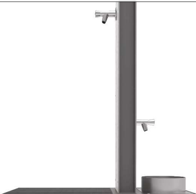
Trinkbrunnen mit Hundestation FONTIS DOG, Wandelemente aus Edelstahl