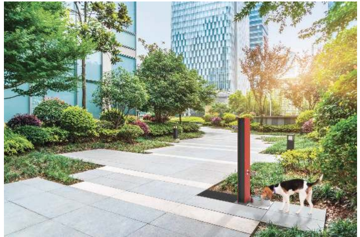
Trinkbrunnen mit Hundestation FONTIS DOG, Wandelemente aus Stahl in RAL 2002 blutorange