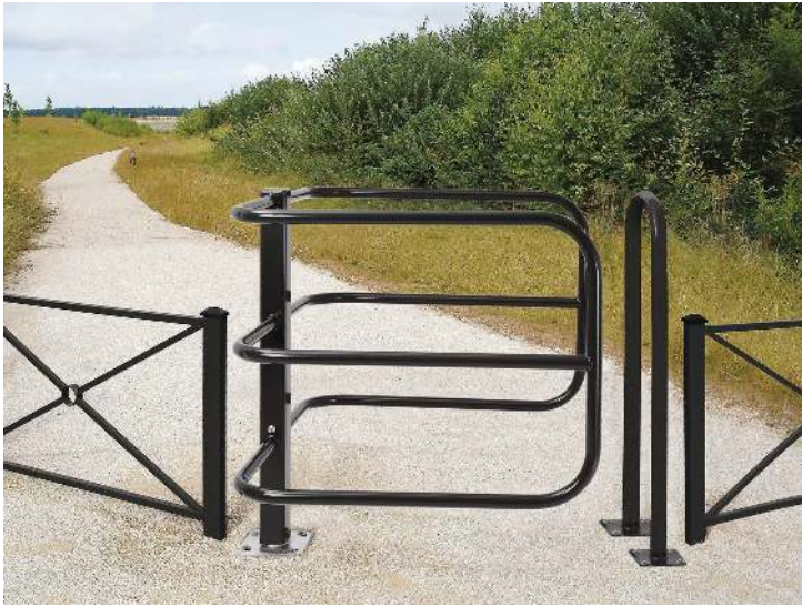
Drehsperre VENDEE in RAL 9005 tiefschwarz