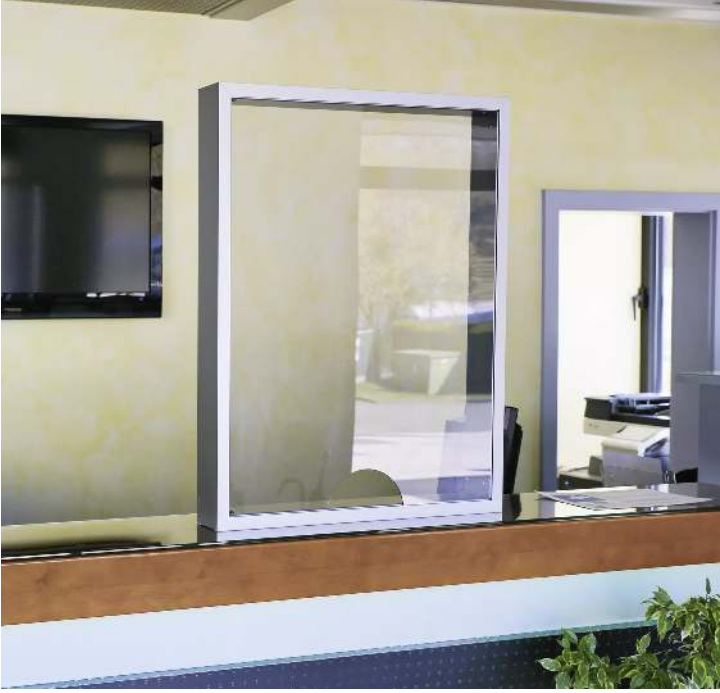
Trennwand EVISA, B x T x H 635 x 100 x 835 mm