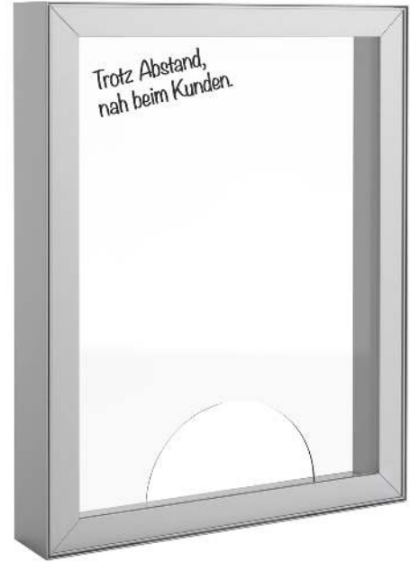
Trennwand EVISA, B x T x H 640 x 120 x 840 mm