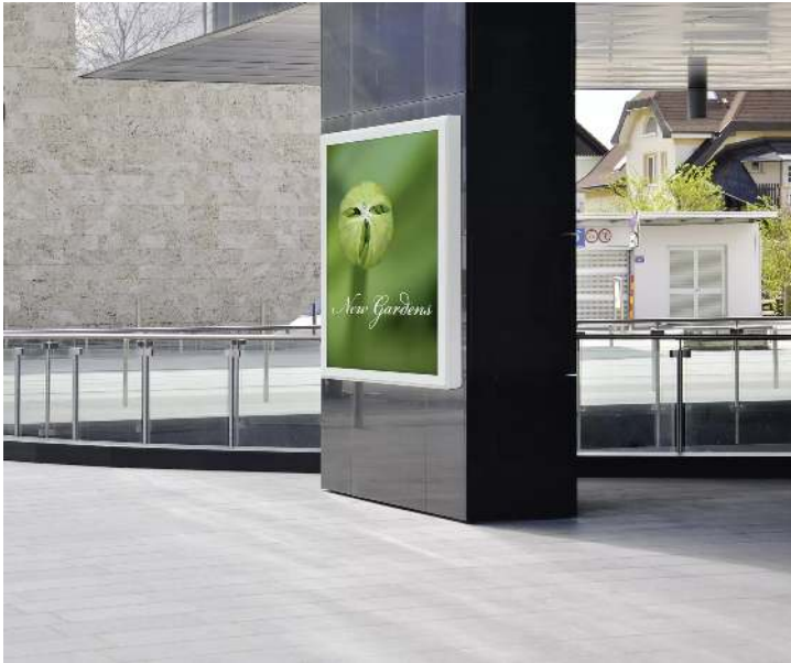
Werbevitrine CITY-LIGHT, einseitig, Alu silber