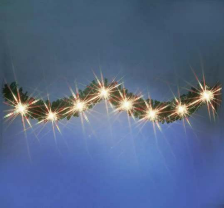
Zweiggirlande STARLIGHT, zur Straßenüberspannung