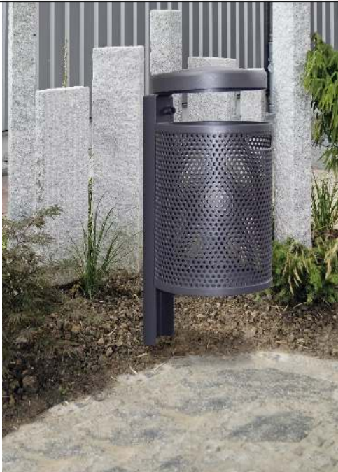
Abfallbehälter KINGSTON, Lochblech, mit Schutzdach, in DB 703 eisenglimmer