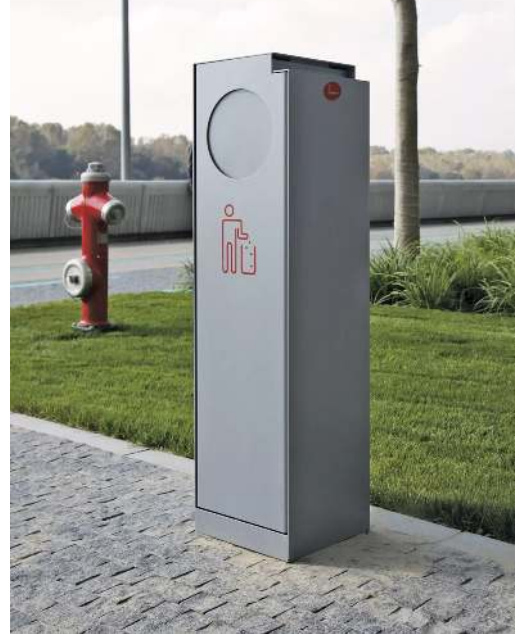
Abfallbehälter CRYSTAL mit Ascher, 32 Liter, mit Einwurfklappe, in RAL 9007 graualuminium, Siebdruck in RAL 3020 verkehrsrot