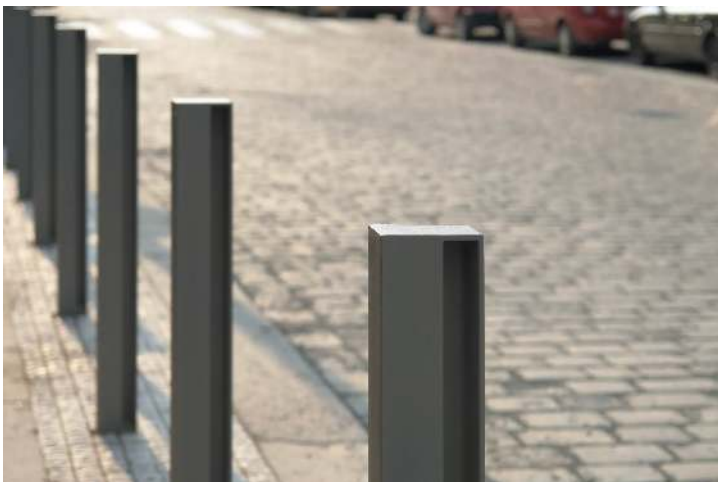
Poller ELIAS ohne Stadtwappen, zum Aufdübeln bei -100 mm, in DB 703 eisenglimmer