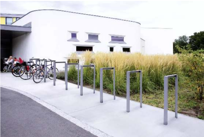
Anlehnbügel LOTLIMIT in DB 703 eisenglimmer