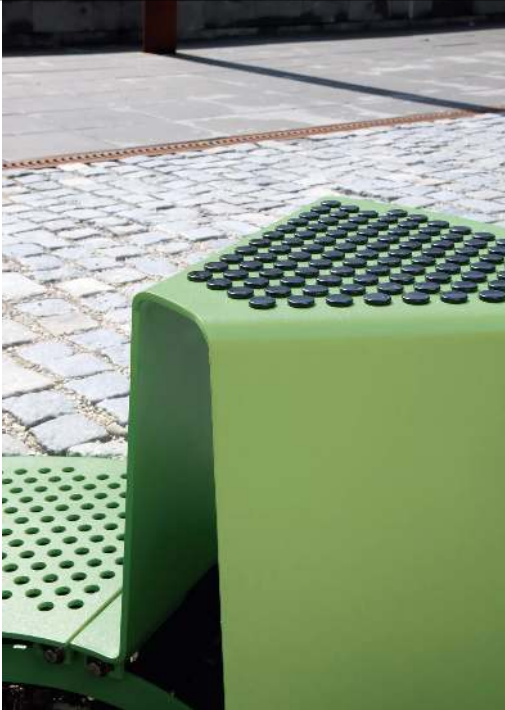
Detail: Sitz mit Kunststoffnoppen