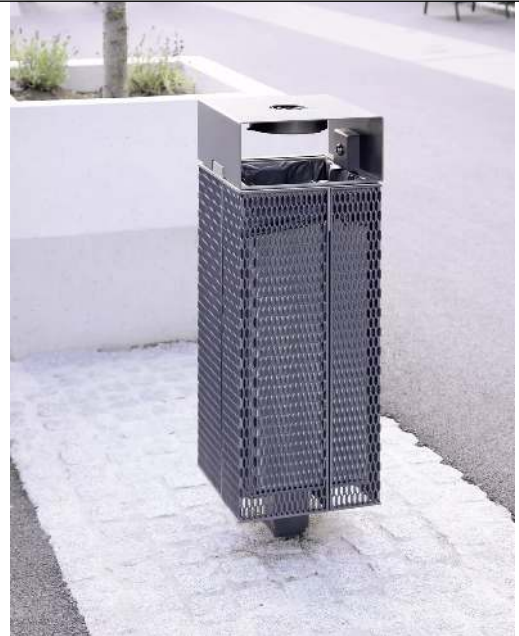
Abfallbehälter NANUK, quadratisch, mit Schutzdach und Ascher, Korpus: Streckmetall, in RAL 7016 anthrazitgrau und RAL 9007 graualuminium (zweifarbige auf Anfrage)