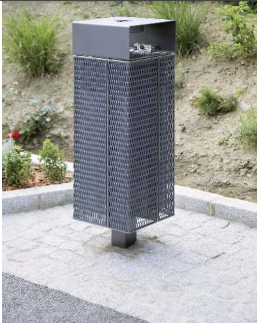
Abfallbehälter NANUK, quadratisch, mit Schutzdach und Ascher, Korpus: Streckmetall, in RAL 9007 graualuminium