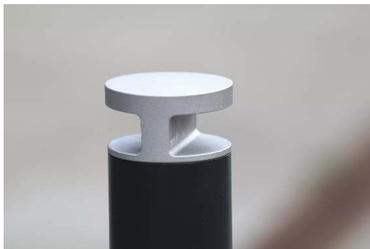
Detail: Kopf in RAL 9006 weißaluminium