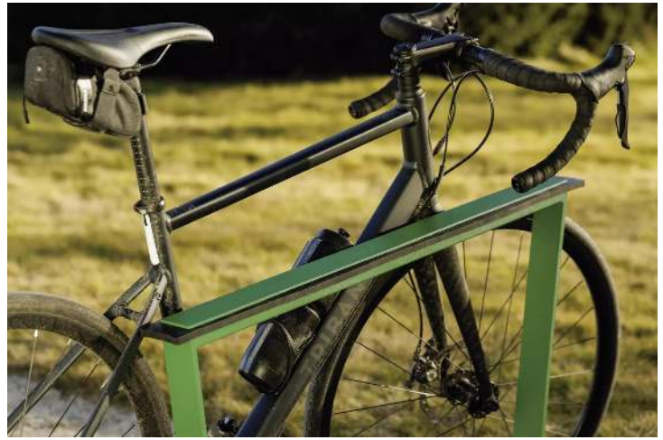
Detail: Das obere schräg angebrachte Element ist mit einem integrierten, widerstandsfähigen Gummistreifen ausgerüstet