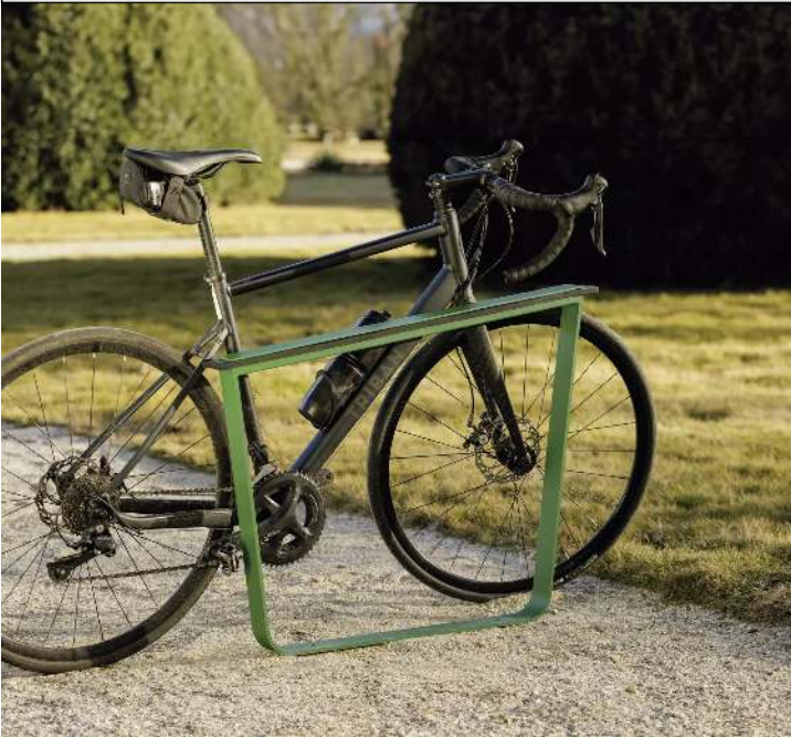
Anlehnbügel IGLAU, Breite 900 mm, in RAL 6010 grasgrün