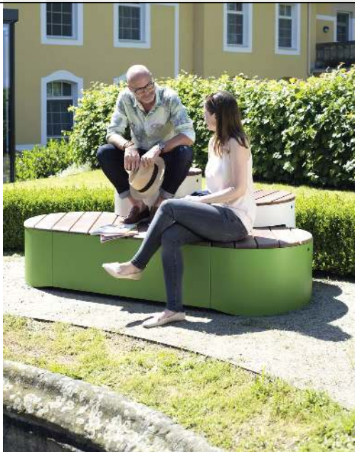
Sitzpodest URBAN ISLANDS, Kombination 2, mit Jatobaholzbelattung, Stahlteile in RAL 9006 weißaluminium und RAL 6010 grasgrün