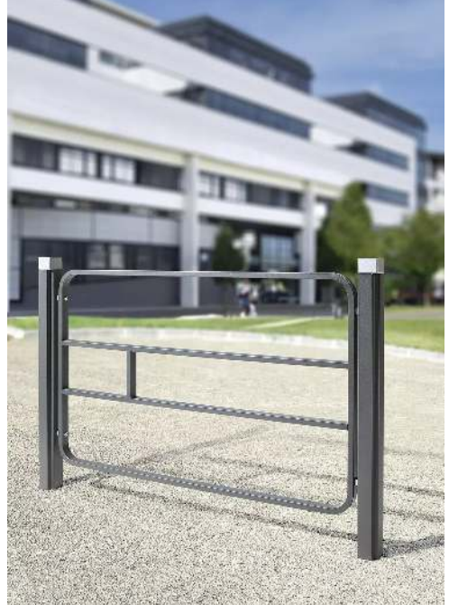
Systemgeländer IMAWA zum Einbetonieren, Stahlteile in RAL 7016 anthrazitgrau