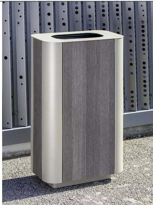
Abfallbehälter PAOSA, Stahlteile in DB 701 eisenglimmer, Korpus aus grauem Zedernholz