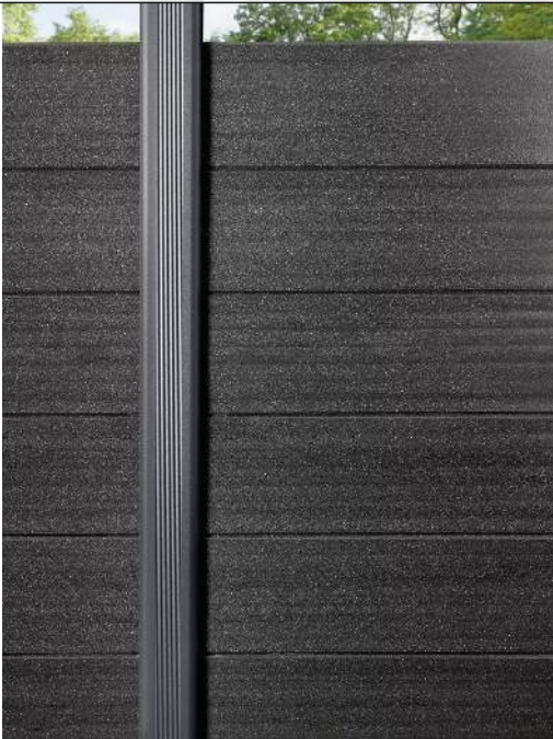
Detail: Grundstütze, Standardausführung für Sicht- und Schallschutzwand LYNWOOD in titangrau