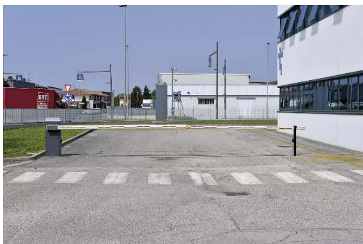
Schrankenanlage BUSSET mit Absperrbreite 7,60 m