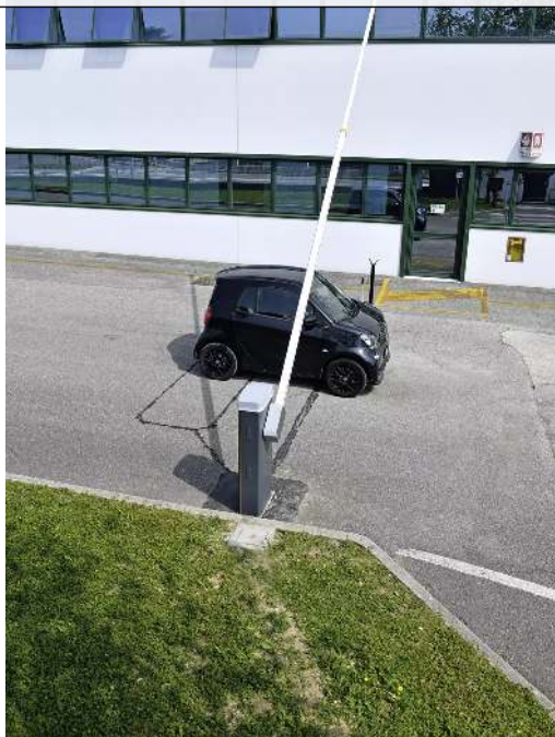
Schrankenanlage BUSSET, Absperrbreite 7,60 m mit 4 + 4 m Teleskop-Schrankenbaum und Auflagestütze