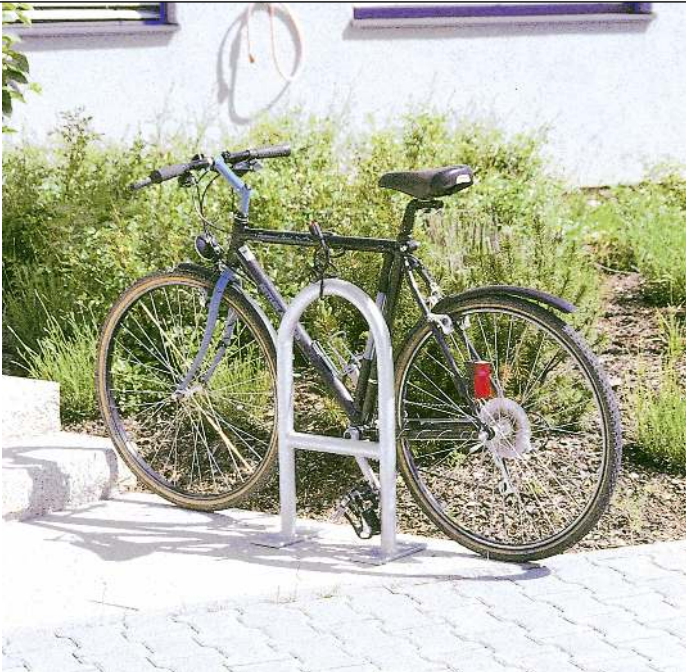
Anlehnbügel MONTANA mit Quersteg, zum Aufdübeln, feuerverzinkt