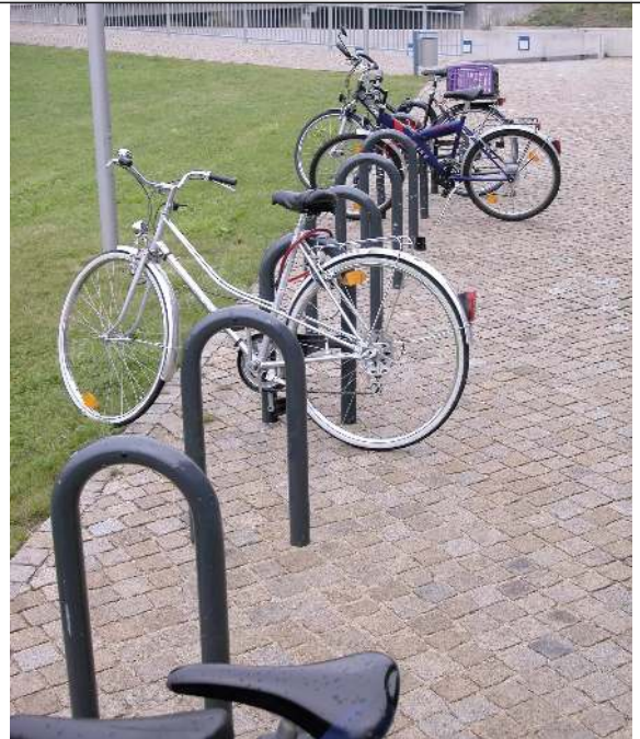
Anlehnbügel MONTANA ohne Querholm, zum Aufdübeln, in Sonderfarbe (auf Anfrage)