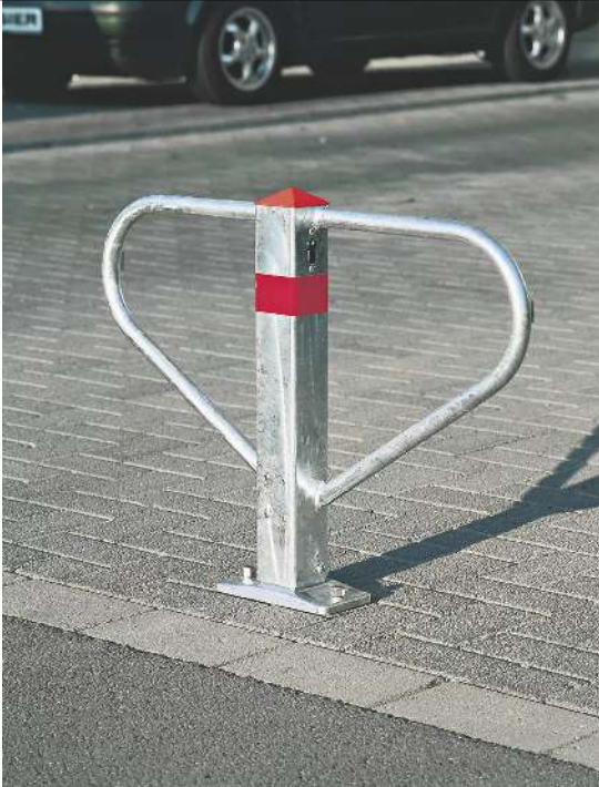
Parkbügel DENIA zum Aufdübeln