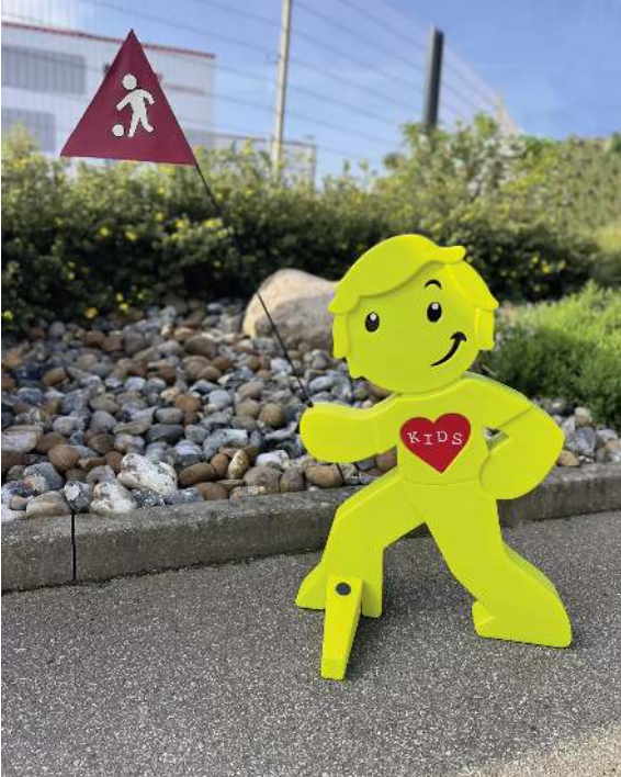
Warnfigur MARLOW in grün