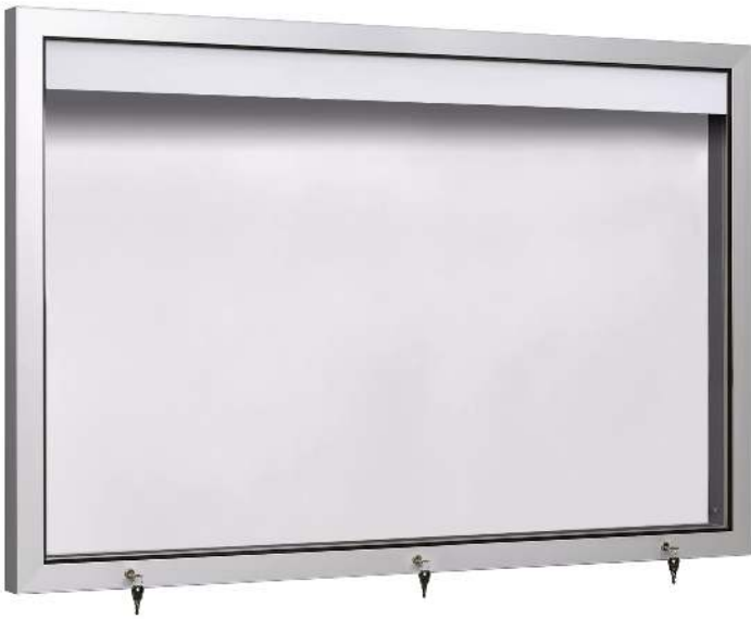
Schaukasten HANKO, Querformat, für 27 x DIN A4, zur Wandbefestigung