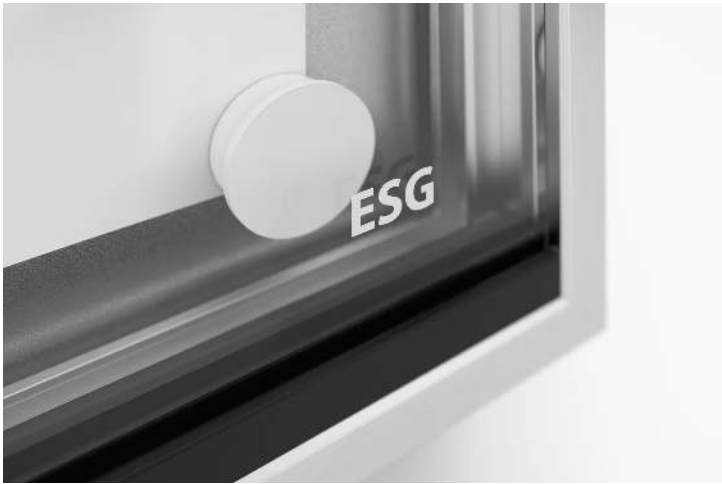
Detail: Glas-Schiebesperrschloss mit 2 Schlüsseln