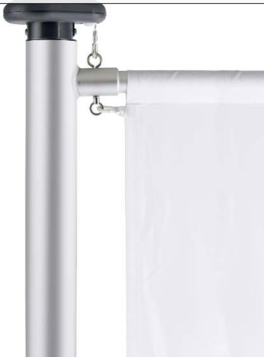
Hissvorrichtung mit Kurbel