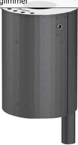
Abfallbehälter BEXHILL mit Ascher, 40 Liter, mit Pfosten, in DB 703 eisenglimmer