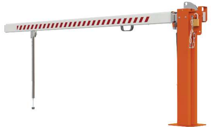
Wegesperre MARAC mit Pendelstütze, Hauptstütze in RAL 2004 reinorange