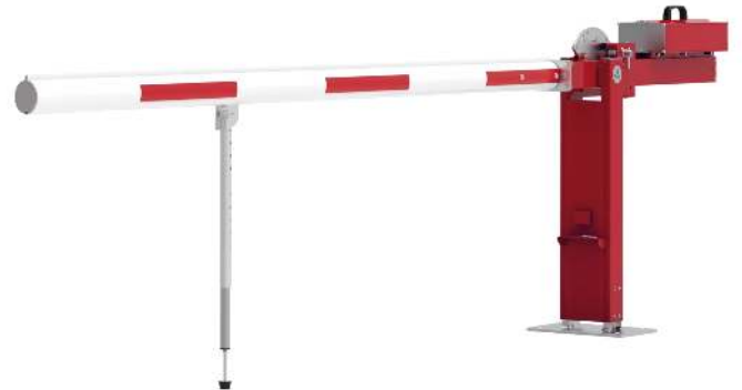
Wegesperre MOTALA NEW, zum Aufdübeln, mit Pendelstütze