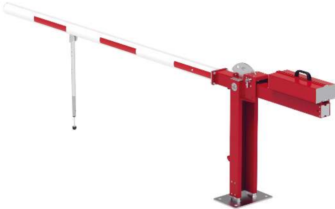
Wegesperre MOTALA NEW, zum Aufdübeln, mit Pendelstütze