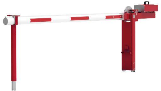
Wegesperre MOTALA NEW, zum Einbetonieren, mit fester Auflagestütze