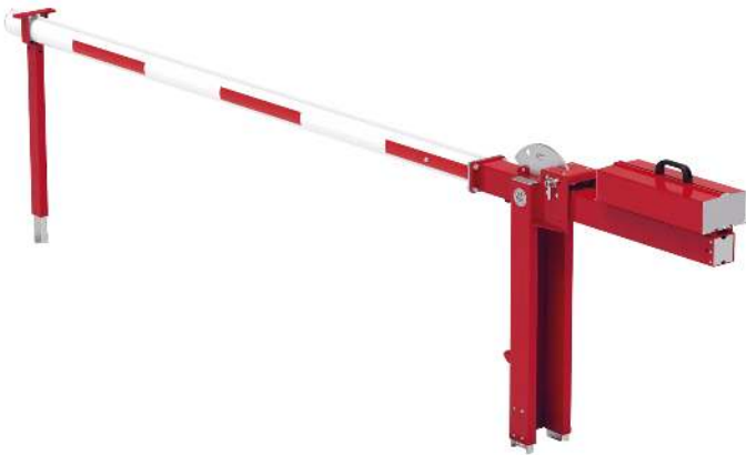
Wegesperre MOTALA NEW, zum Einbetonieren, mit fester Auflagestütze