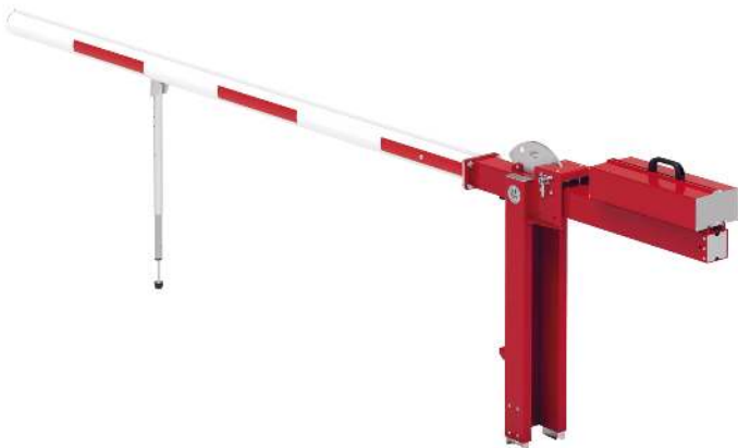
Wegesperre MOTALA NEW, zum Einbetonieren, mit Pendelstütze