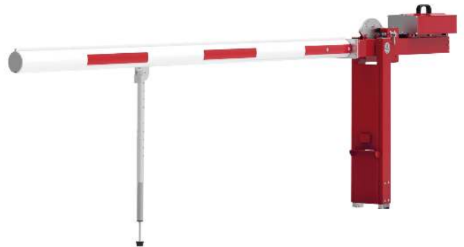
Wegesperre MOTALA NEW, zum Einbetonieren, mit Pendelstütze