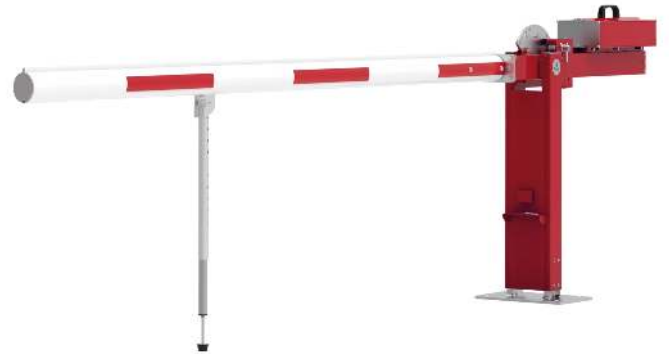
Wegesperre MOTALA NEW, zum Aufdübeln, mit Pendelstütze